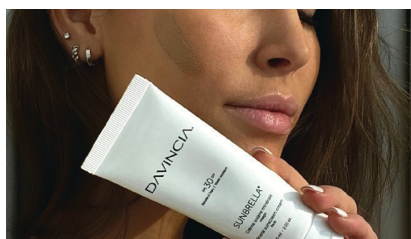
Crème solaire minérale | visage offerte en 2 teintes