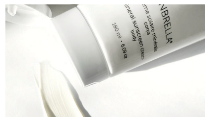
Crème solaire minérale | corps